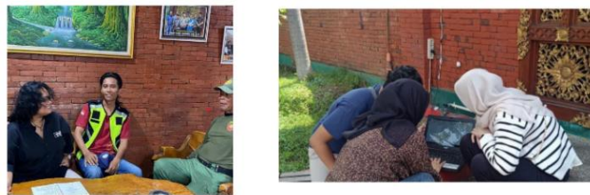
Gambar 1. Sosialisasi dan Penerapan Nilai Hospitality

Integrasi nilai hospitality dan literasi wisata merupakan bentuk hilirisasi dari hasil penelitian dan praktik lapangan yang menekankan pentingnya penguatan kapasitas masyarakat lokal melalui pelatihan, sosialisasi, serta pengembangan sarana edukatif. Literasi wisata berfungsi meningkatkan kesadaran pengunjung terhadap sejarah, budaya, dan lingkungan destinasi (Hidayah and Rahmawati 2022) . Sementara itu, penerapan nilai hospitality memperkuat aspek pelayanan prima, etika, dan kenyamanan wisatawan (Muliatie, Yurilla Endah; Susanti et al. 2023).