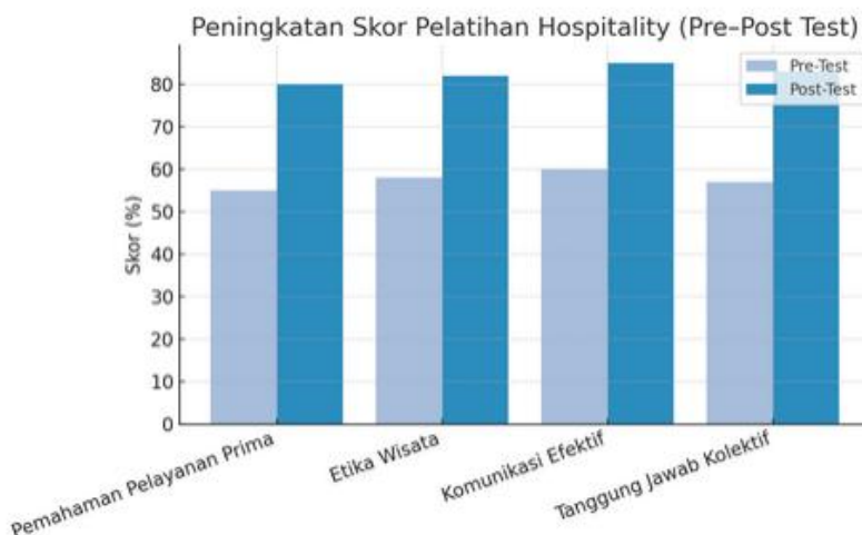
Gambar 4. Diagram Peningkatan Skor Pelatihan (Pre-post test)

Berikut grafik peningkatan skor pelatihan hospitality yang menunjukkan adanya kenaikan signifikan pada seluruh aspek penilaian mulai dari pemahaman pelayanan prima hingga tanggung jawab kolektif setelah pelaksanaan pelatihan.